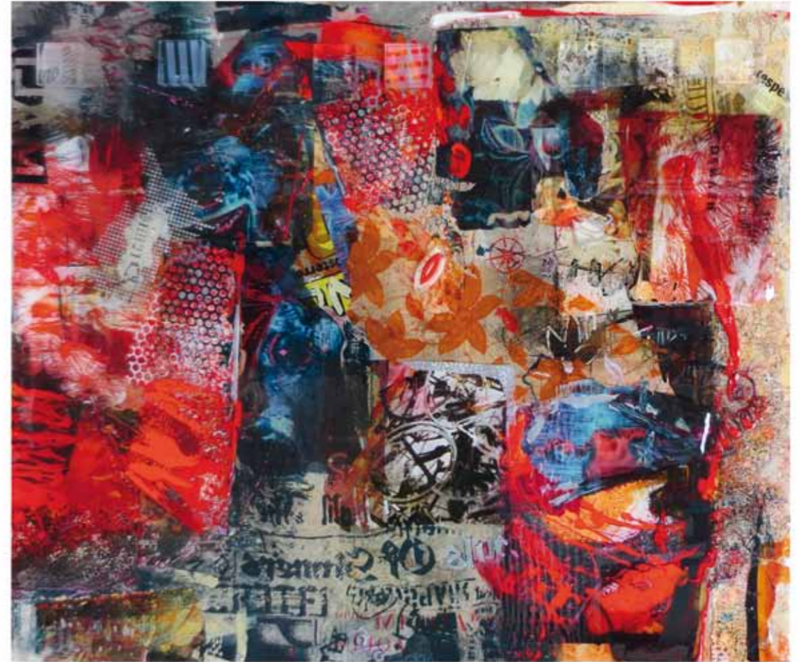
Deja-vu I, 2017/18 Collage: Mischtechnik, Harz auf Leinwand 90 x 108cm