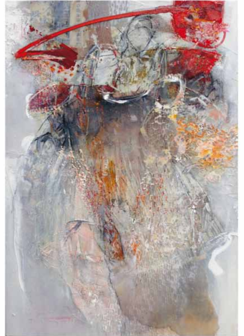
fruchtbare Momente, 2017 Collage: Öl, Harz auf Leinwand 120 x 100cm