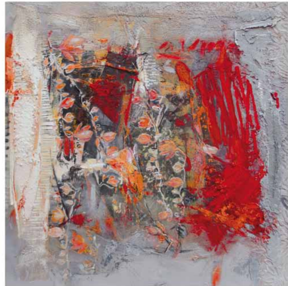
Partitur, 2017 Collage: Öl auf Leinwand 100 x 100cm