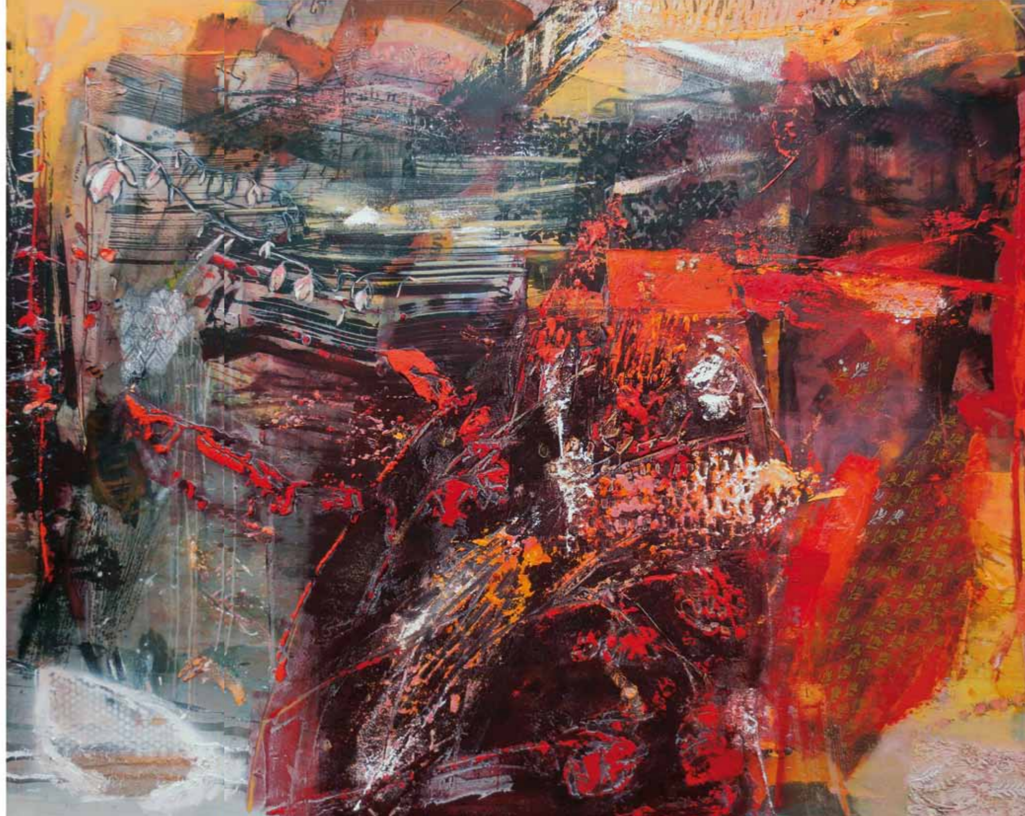
Manaus, 2016/17 Collage: Öl auf Leinwand 150 nx 190cm