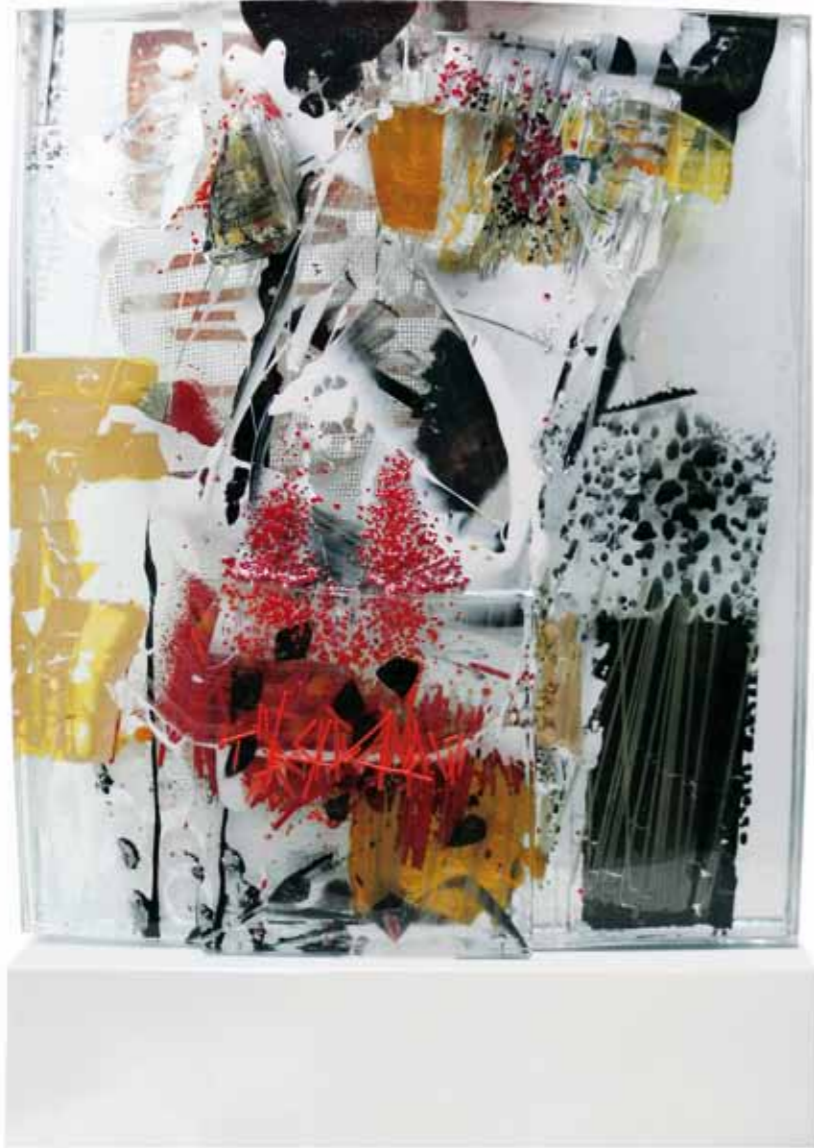
H29/1, 2017 Glasobjekt auf Stahlsockel, 50 x 36 x 7cm