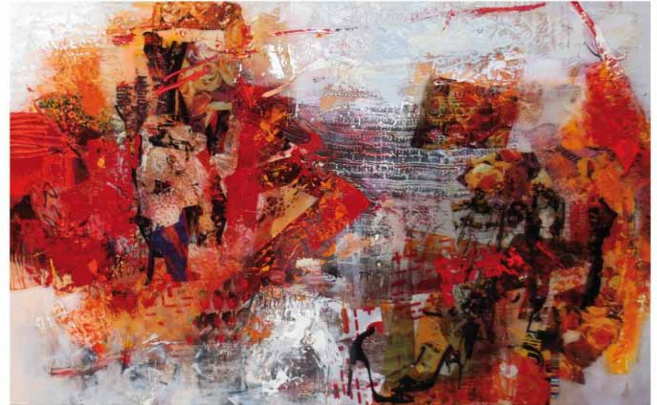
Zwanglos, 2017/18 Collage: Öl, Harz auf Leinwand 120 x 190cm