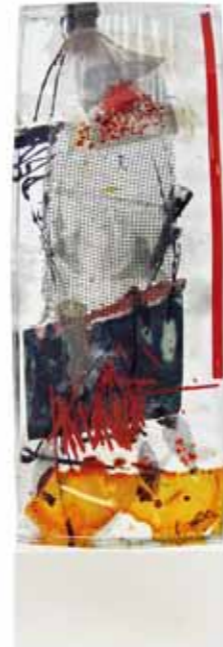
Herbarium I, 2014 Glasobjekt auf Stahlsockel 47 x 16 x 4cm