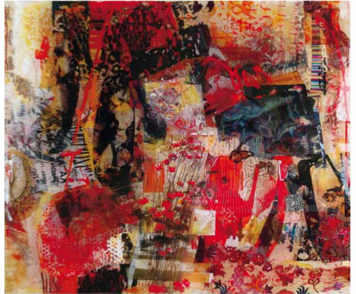
Deja-vu II, 2017/18 Collage: Mischtechnik, Harz auf Leinwand 90 x 108cm