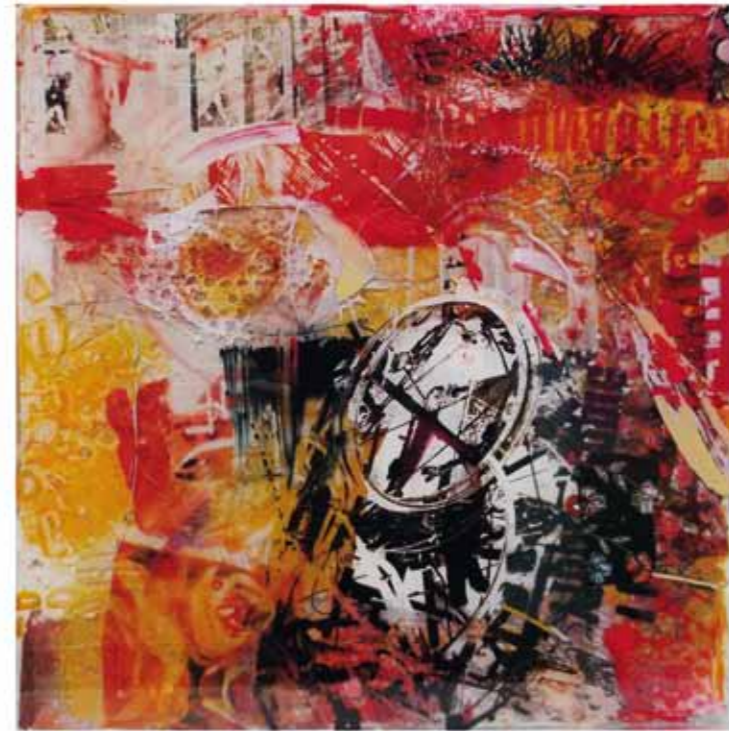
Brand Neu I - II, 2018 Collag: Mischtechnik, Harz auf Bütten 54 x 54 x 3cm