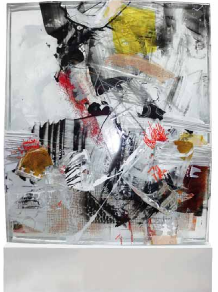
H29/2, 2017 Glasobjekt auf Stahlsockel 50 x 36 x 8cm