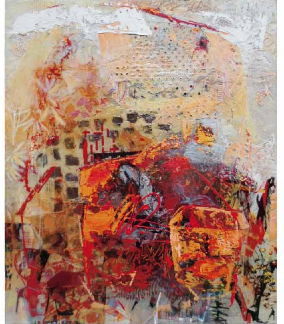
Bei Sich Sein, 2017/18 Collage: Öl, Harz auf Leinwand 120 x 100cm