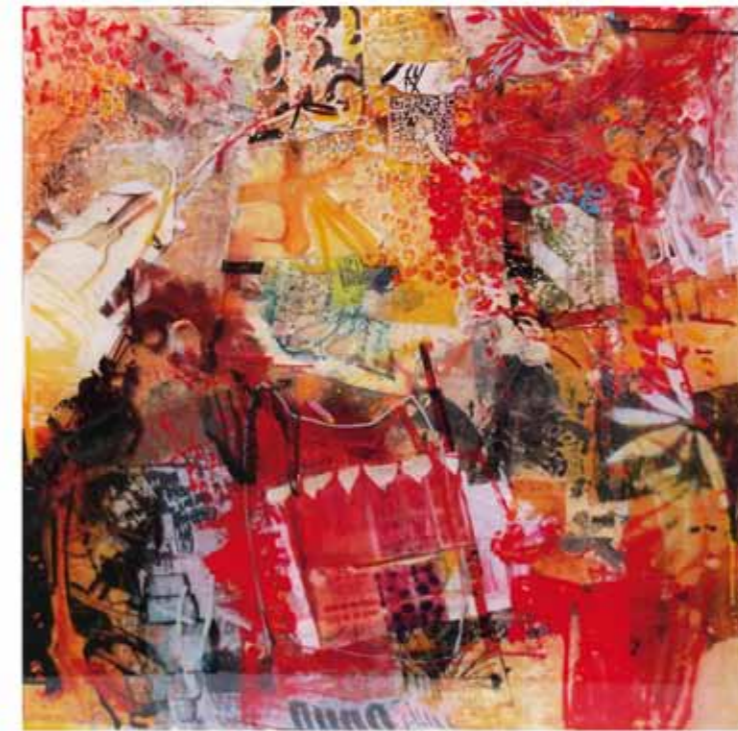
Brand Neu III - IV, 2018 Collag: Mischtechnik, Harz auf Bütten 54 x 54 x 3cm