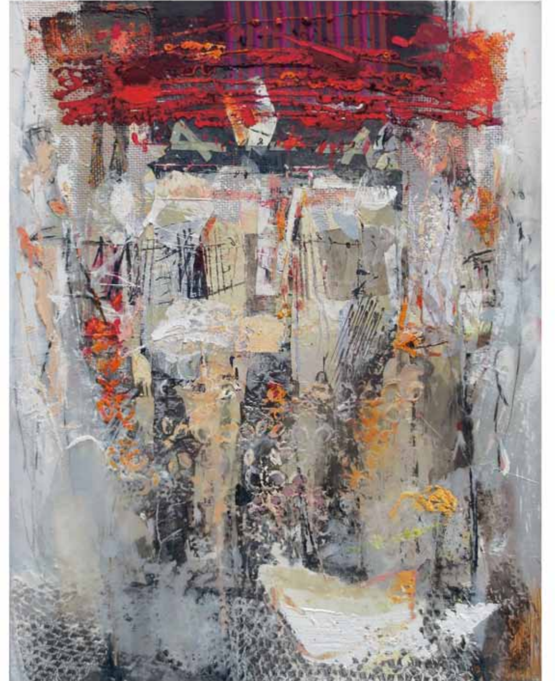
Komposition, 2016/17 Collage: Öl, Harz auf Leinwand 150 x 120cm